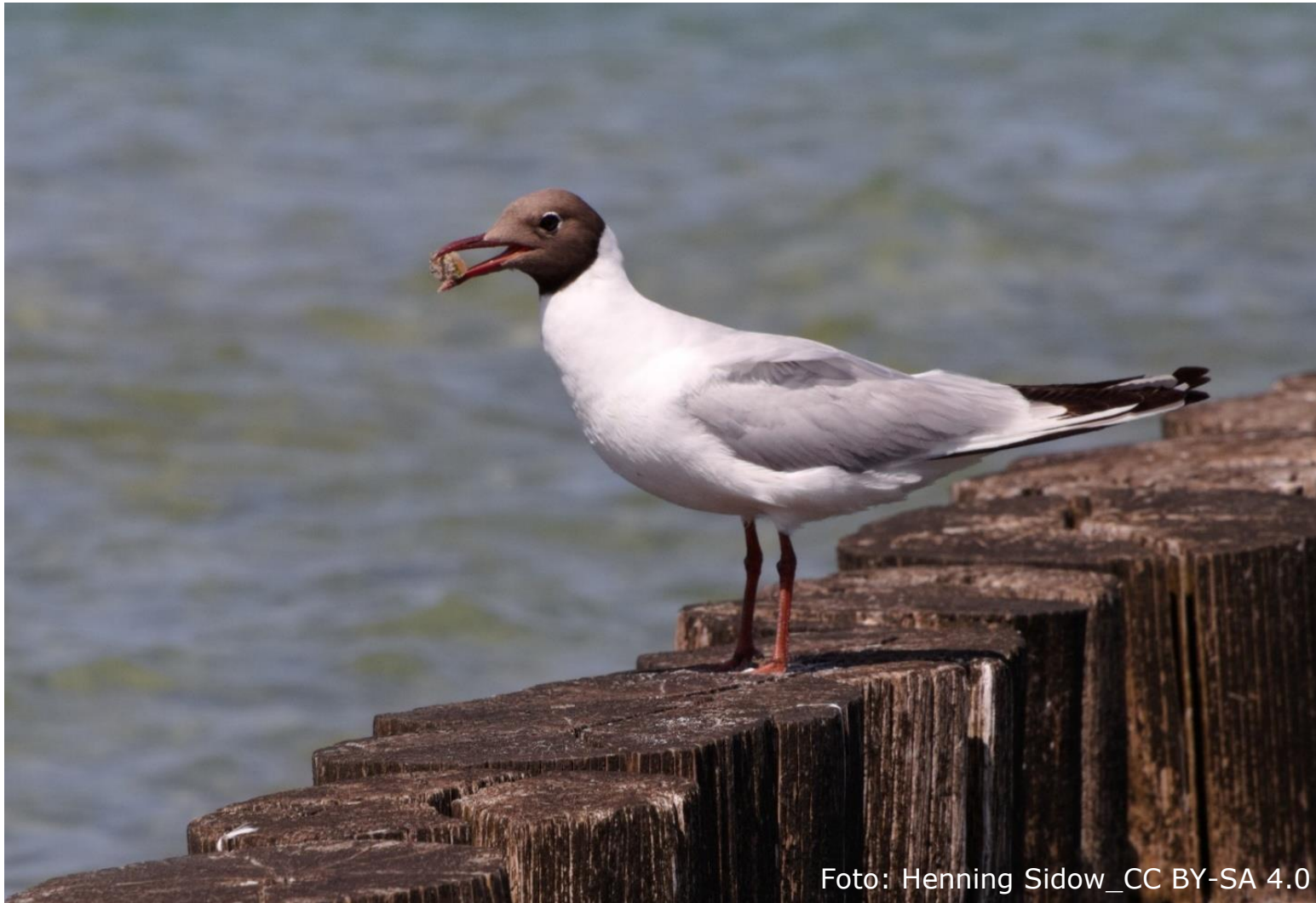
Lachmöwe (Fam. Möwen)