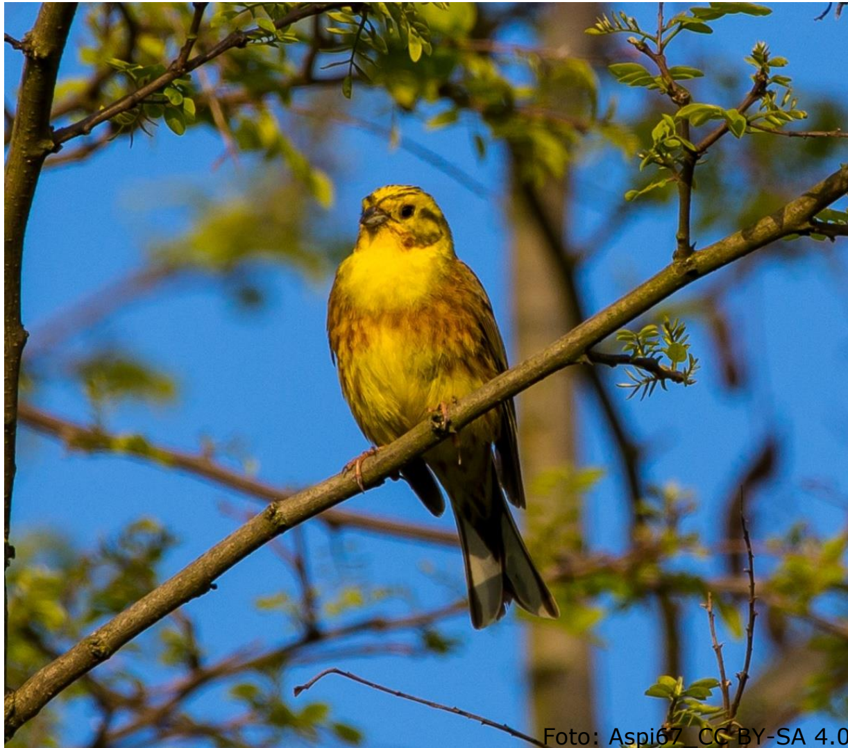
Goldammer (Fam. Ammern)