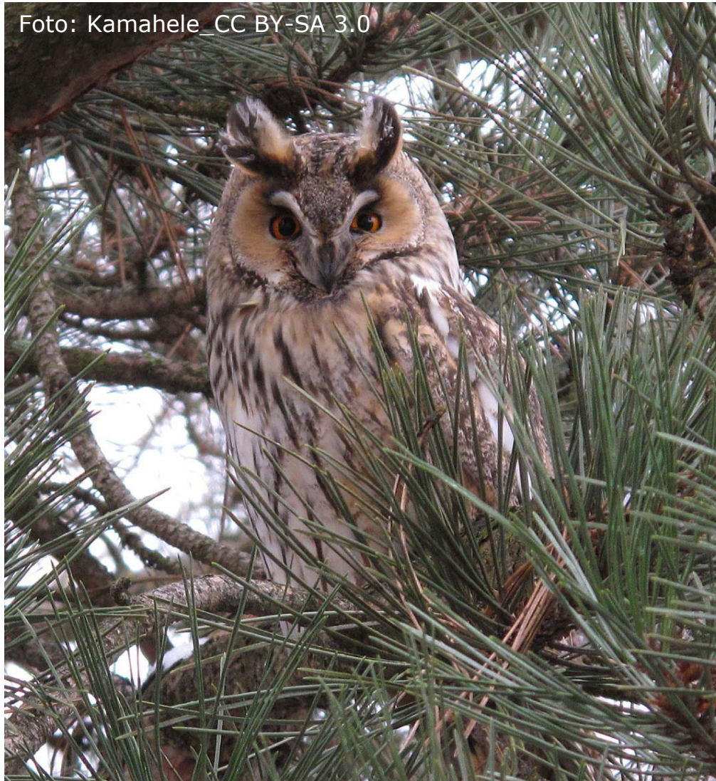
Waldohreule (Fam. Eigentliche Eulen)