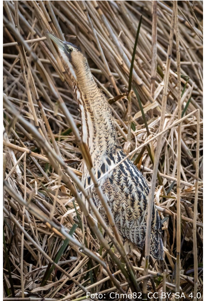
Rohrdommel (Fam. Reiher)