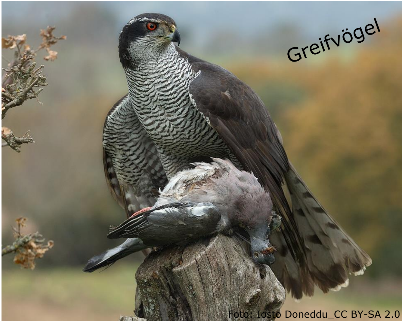
Habicht (Fam. Habichtartige)