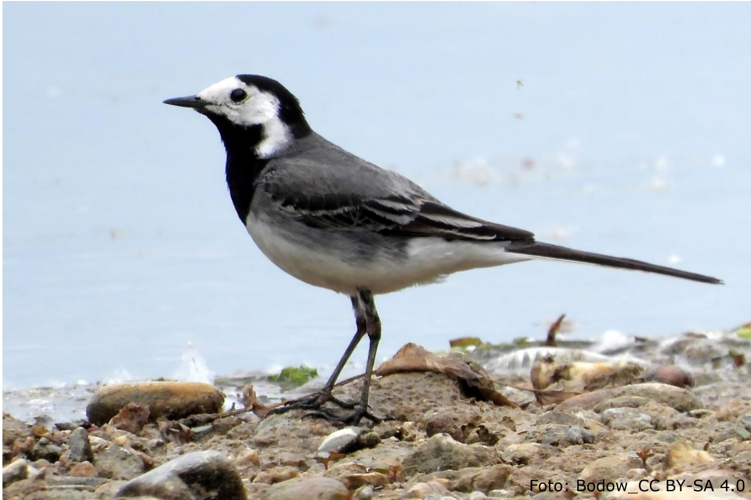
Bachstelze (Fam. Stelzen und Pieper)