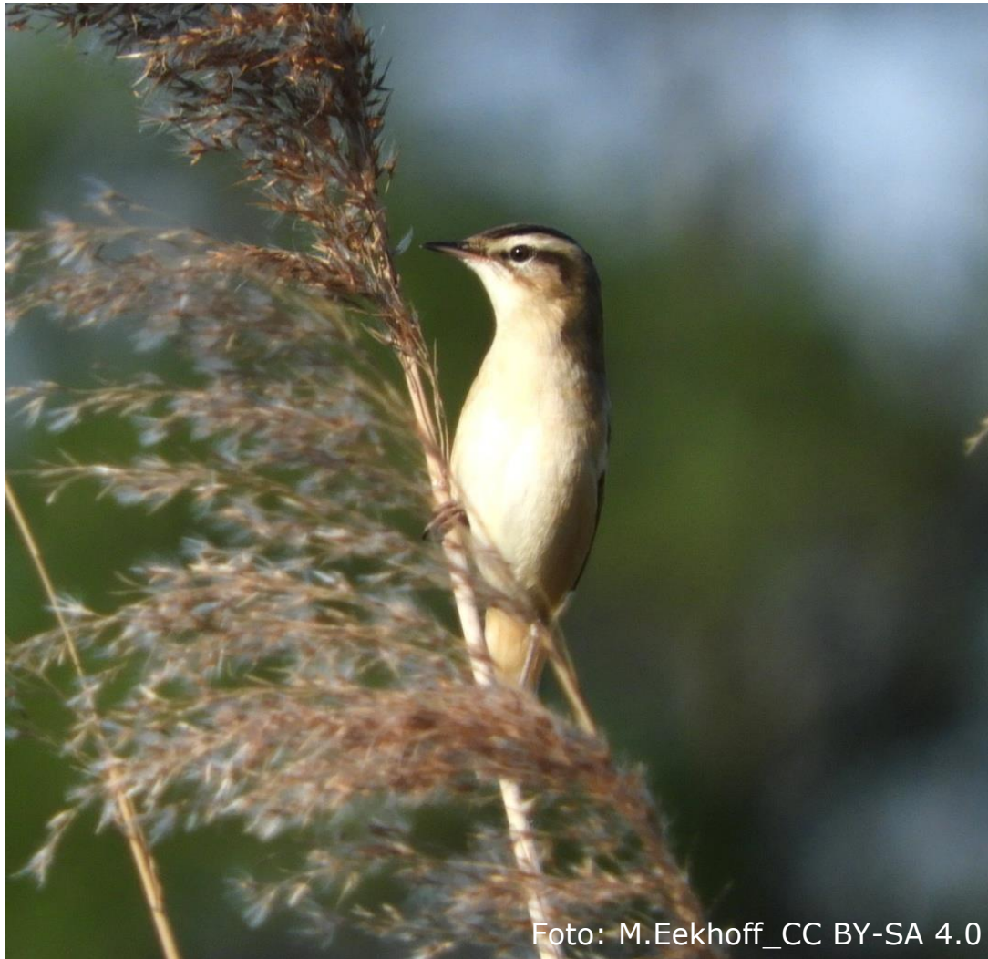
Schilfrohrsänger (Fam. Rohrsängerartige)