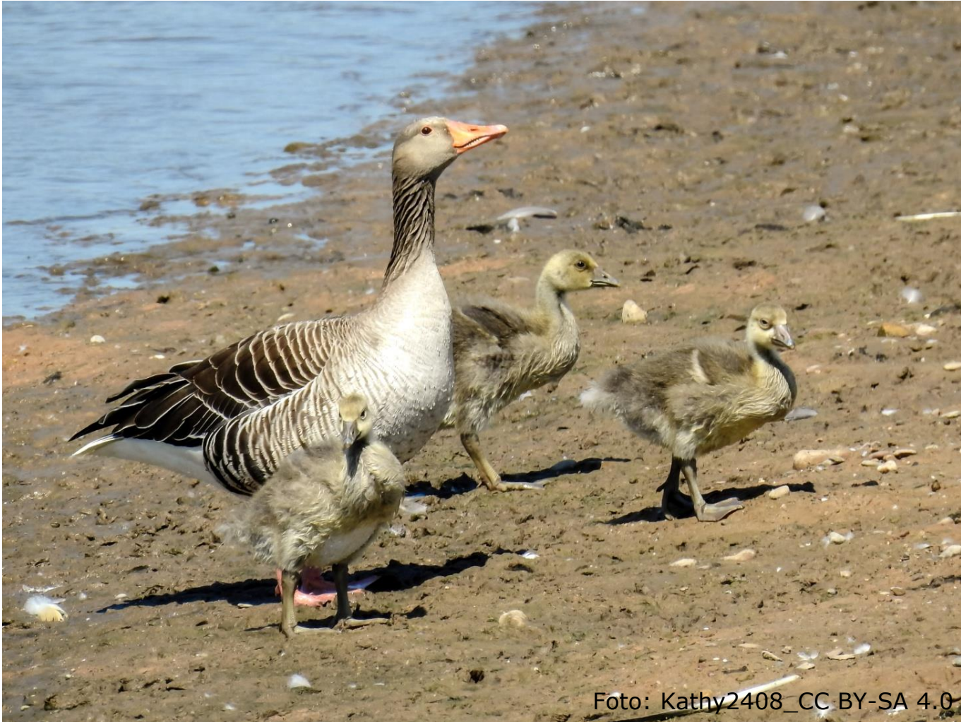
Graugans (Fam. Entenvögel)