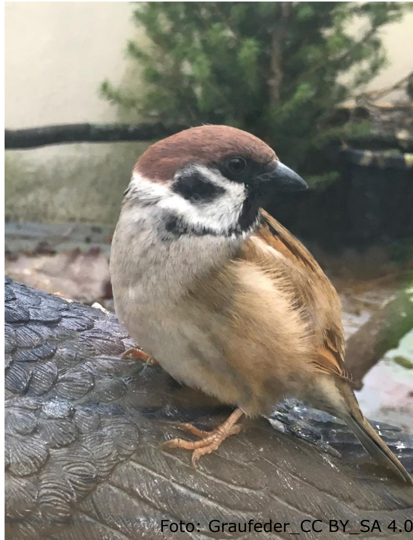
Feldsperling (Familie: Sperlinge)