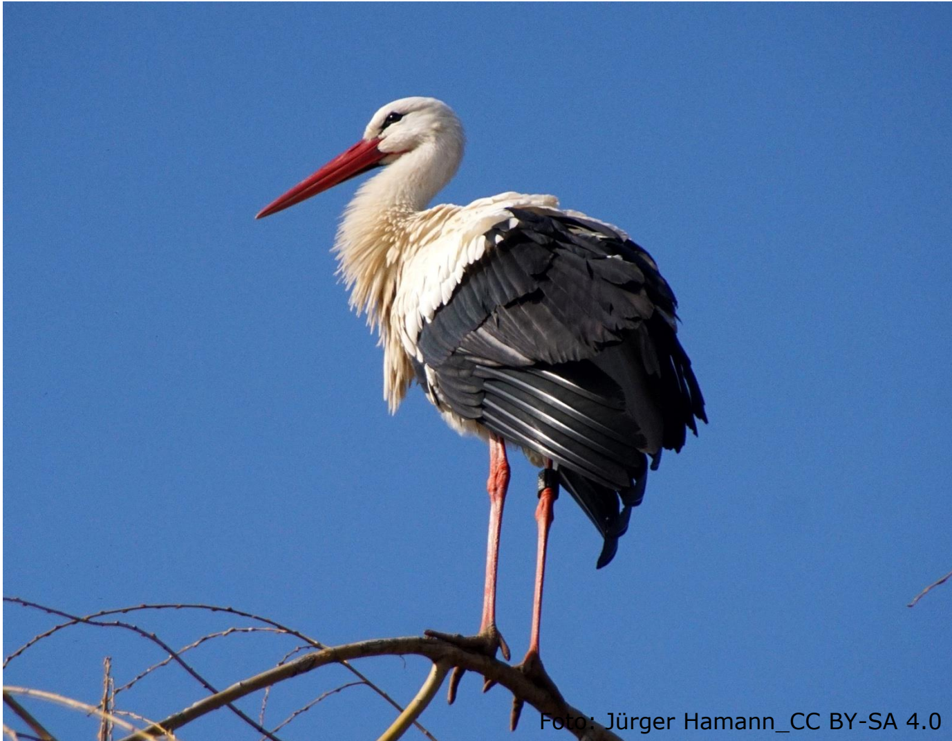
Weissstorch (Fam. Störche)