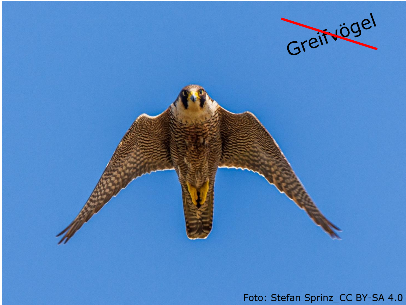
Wanderfalke (Fam. Falken)

Näher mit Sperlingsvögel und Papageien verwandt