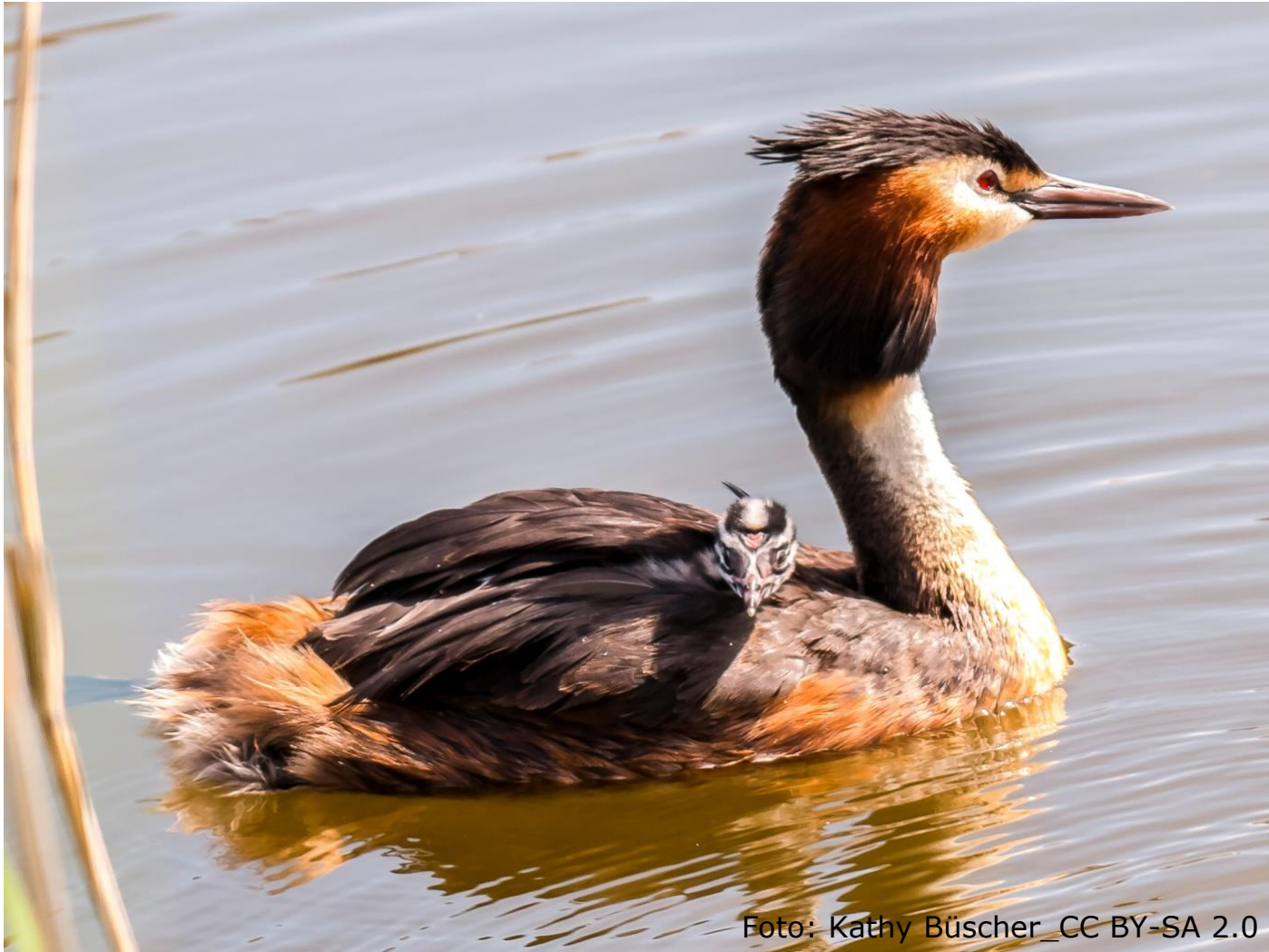
Haubentaucher (Fam. Lappentaucher)