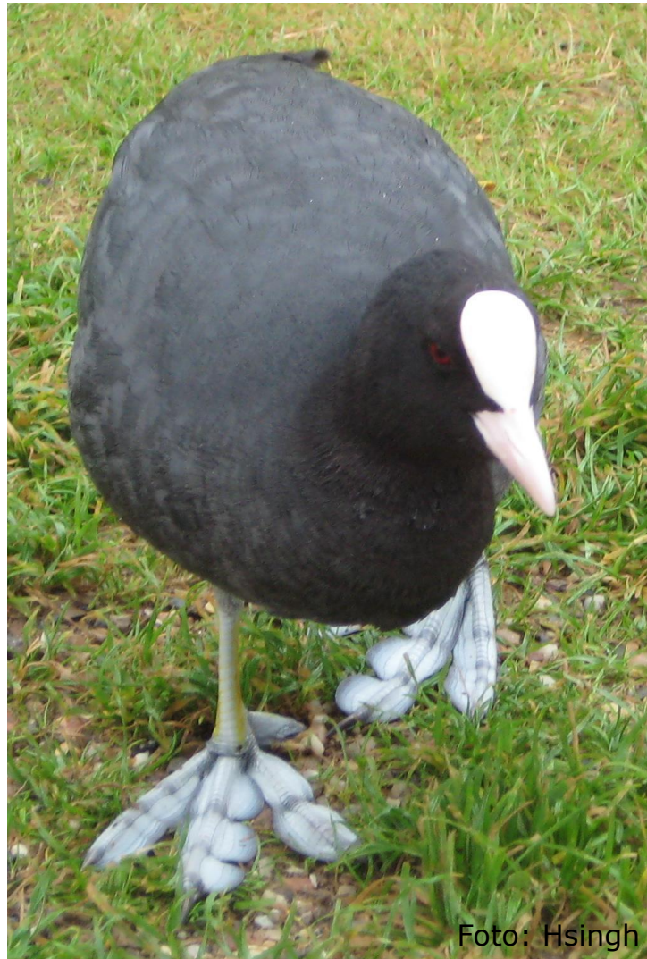
Blässhuhn (Fam. Rallen)