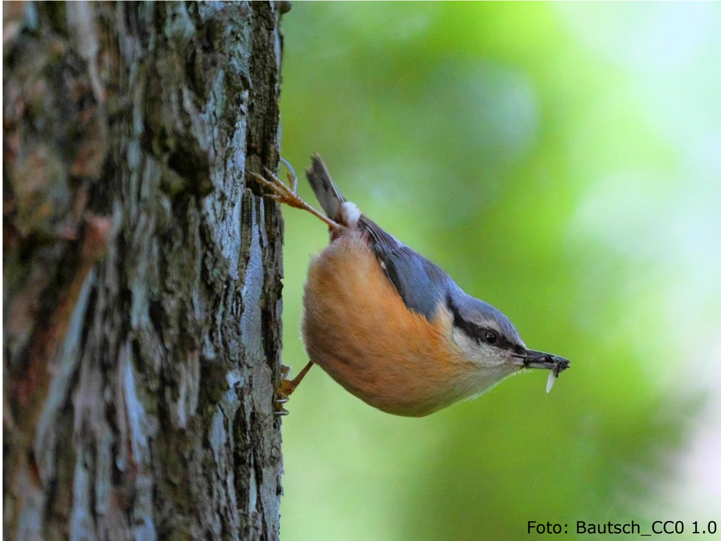
Kleiber (Fam. Kleiber)