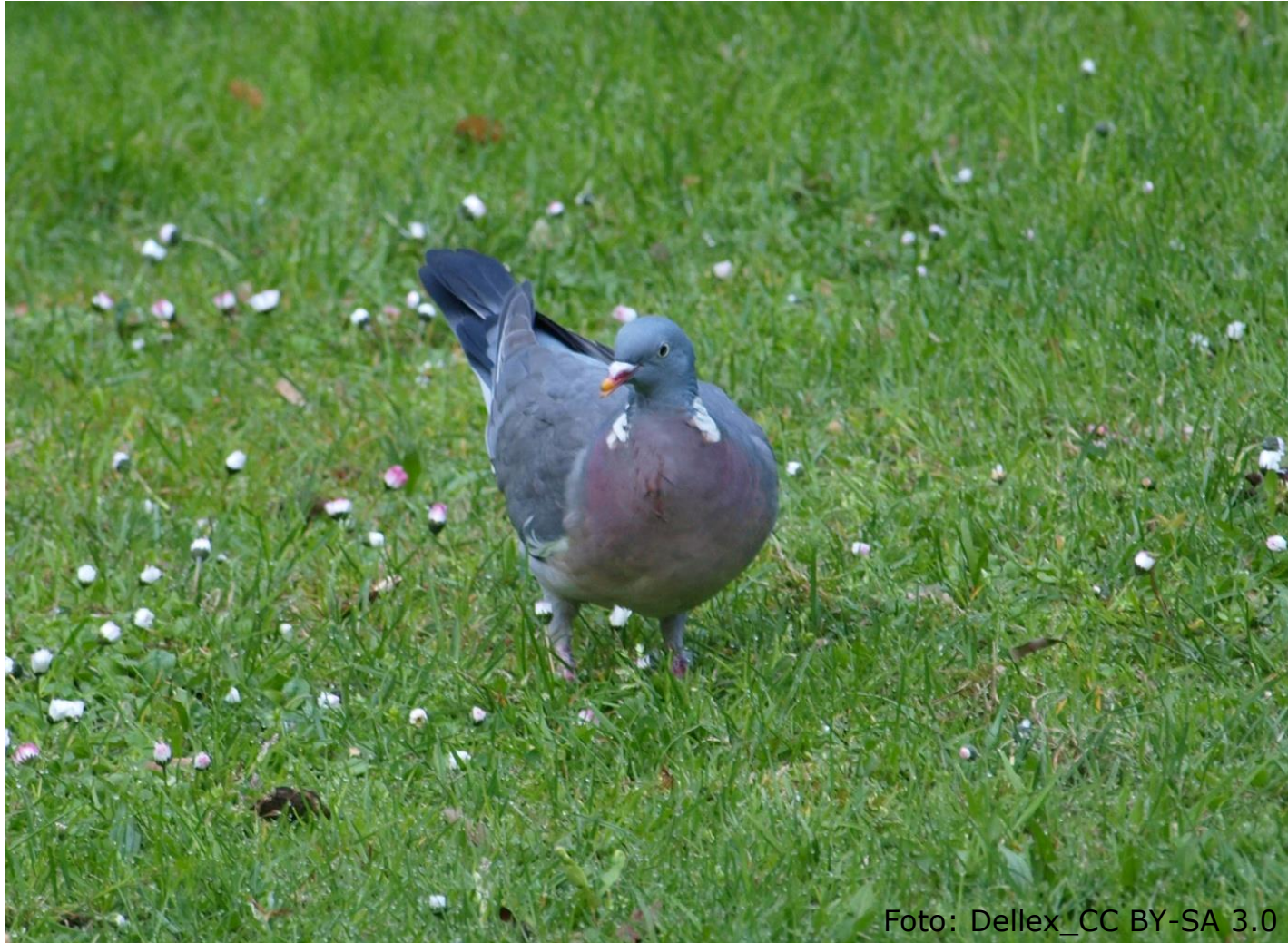
Ringeltaube (Fam. Tauben)