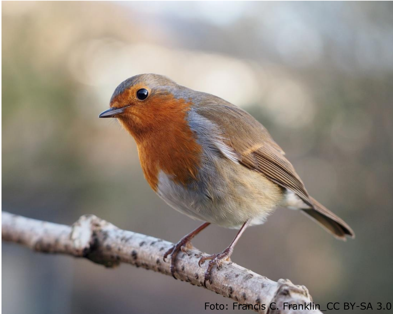
Rotkelchen (Fam. Fliegenschnäpper)