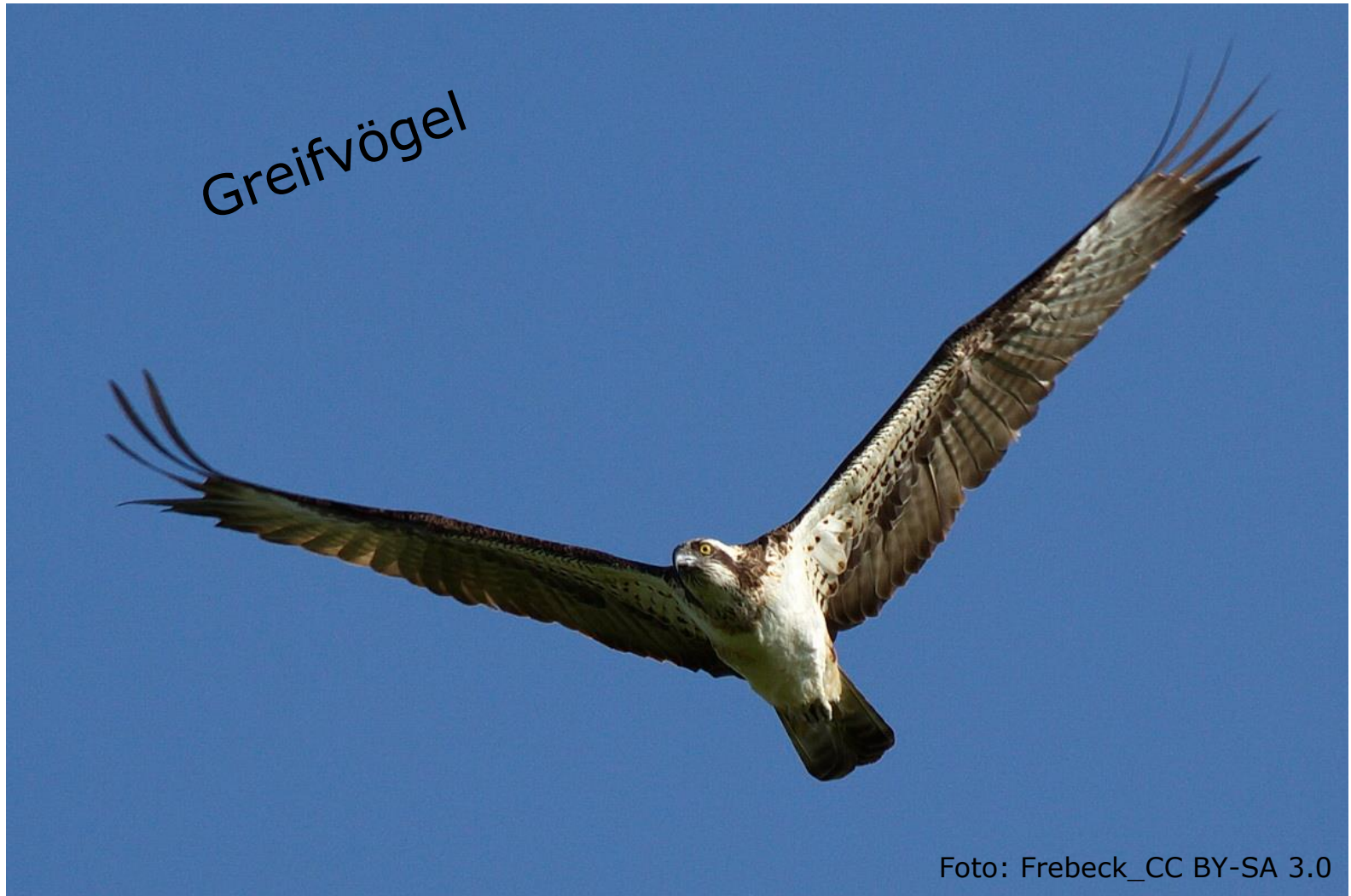
Fischadler (Fam. Fischadler)