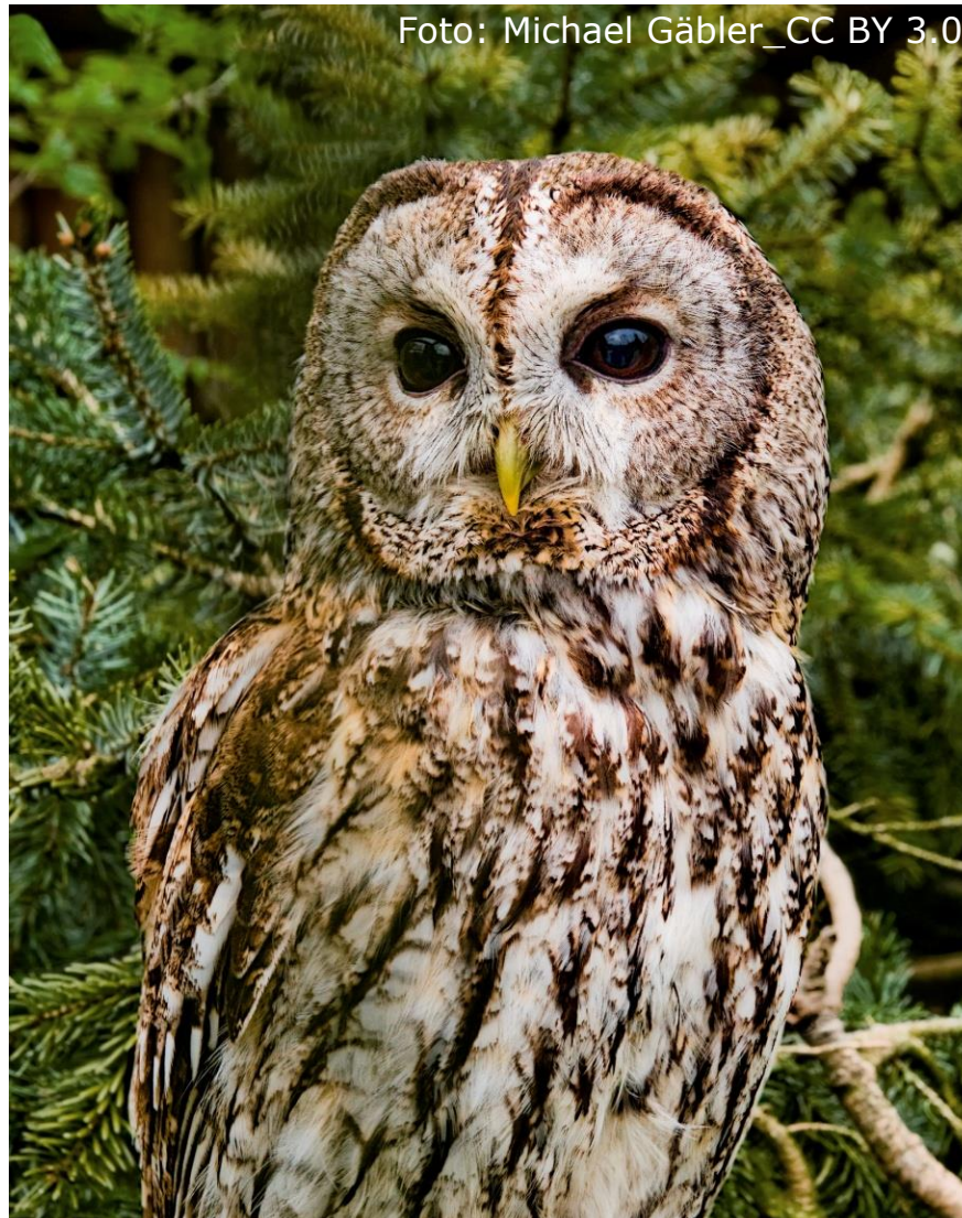
Waldkauz (Fam. Eigentliche Eulen)