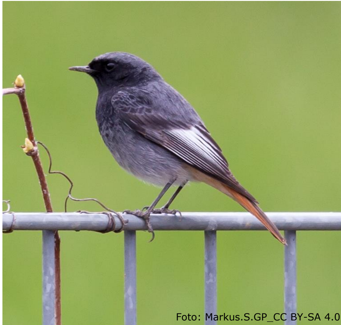
Hausrotschwanz (Fam. Fliegenschnäpper)