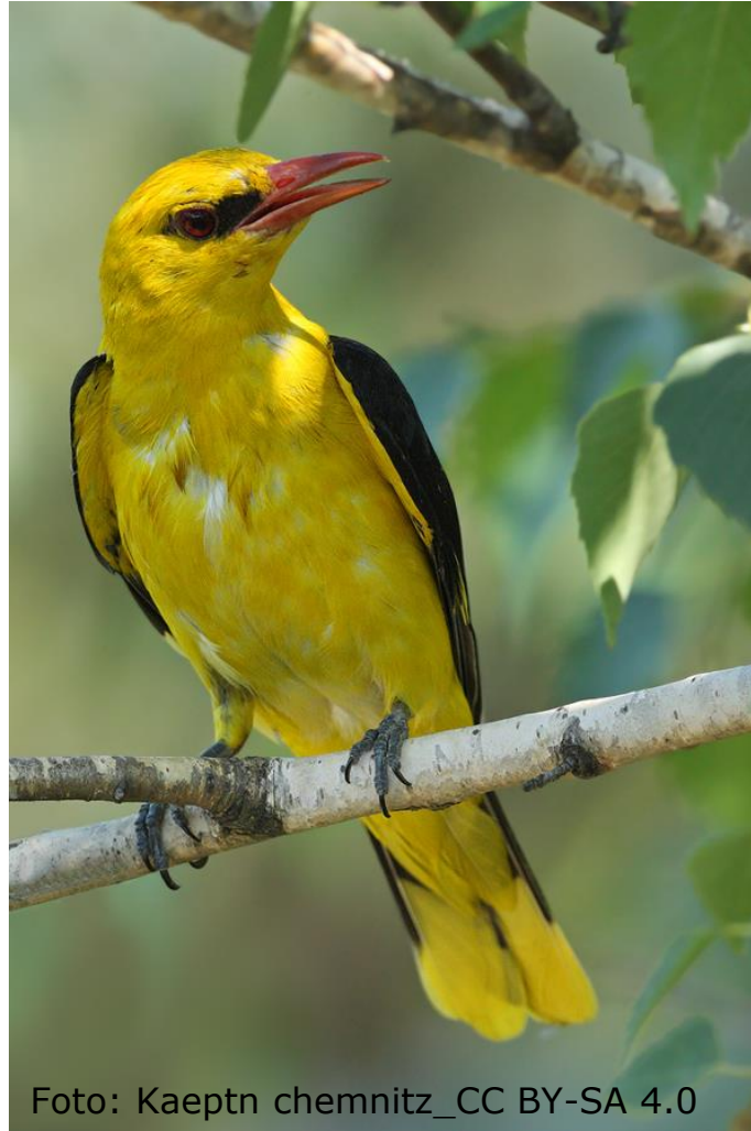
Pirol (Fam. Pirole)