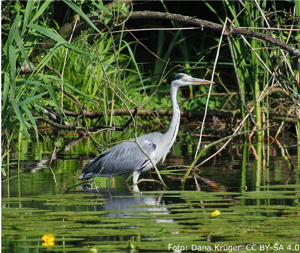
Graureiher (Fam. Reiher)