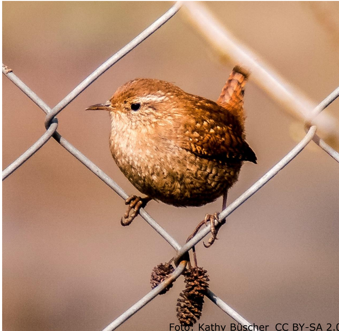
Zaunkönig (Fam. Zaunkönige)